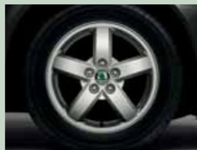
Kola z lehké slitiny Triton 6,0J x 15" s pneumatikami 195/65 R15