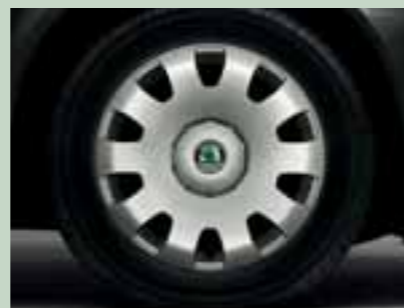
Kola ocelová 6,0J x 15" s velkoplošnými kryty Drive s pneumatikami 195/65 R15