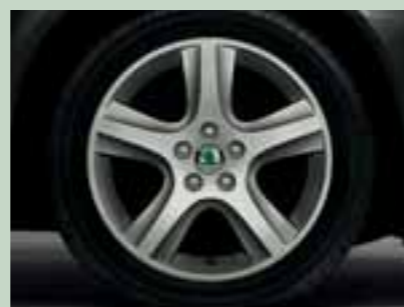
Kola z lehké slitiny Knife 6,5J x 16" s pneumatikami 205/55 R16