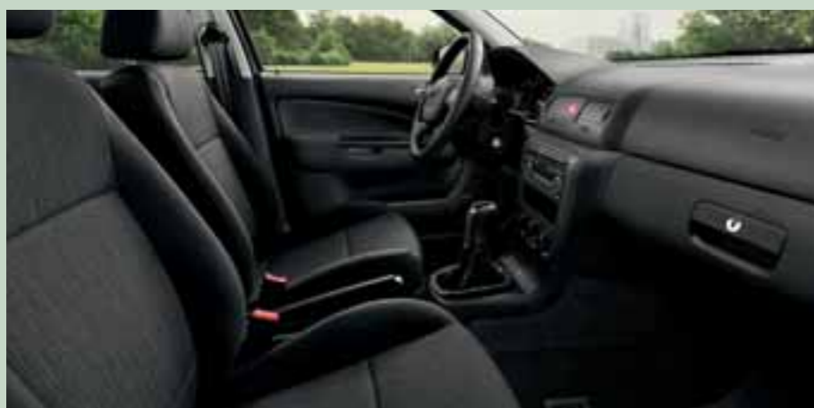
Interiér Eminent Onyx