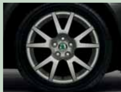
Kola z lehké slitiny Spider 6,5J x 16" s pneumatikami 205/55 R16 (součást sportovního balení)