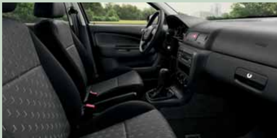
Interiér Scale šedý